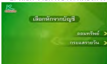
3. เลือก บัญชีที่ต้องการให้หักเงินเพื่อชำระ