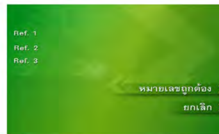
4. ระบุหมายเลขอ้างอิง