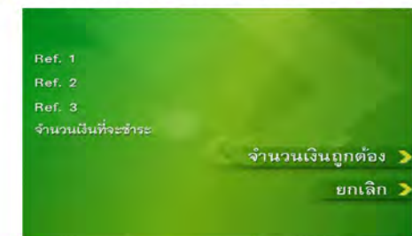
5. ระบุจำนวนเงินที่ต้องการชำระ