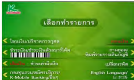
1. เลือก ชำระเงิน/ชำระหนี้ด้วยบาร์โค้ด