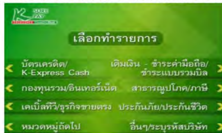
2. เลือก รายการชำระที่ต้องการ