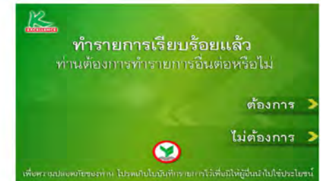
7. ทำรายการเสร็จเรียบร้อยแล้ว